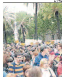
Ampans, en plena manifestació

L'entitat bagenca es mobilitza per primer cop a la història per reclamar els seus drets