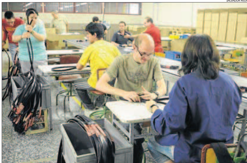
La secció de manipulats del Centre Especial de Treball dona feina a una cinquantena de persones