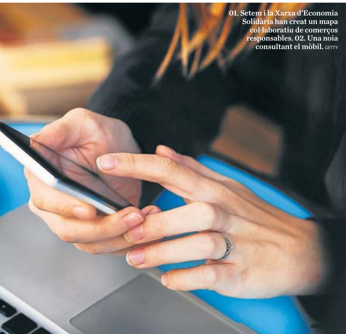
01. Setem i la Xarxa d'Economia Solidària han creat un mapa col·laboratiu de comerços responsables. 02. Una noia consultant el mòbil.

diagnosi de com el tercer sector està utilitzant la tecnologia i quins reptes té.