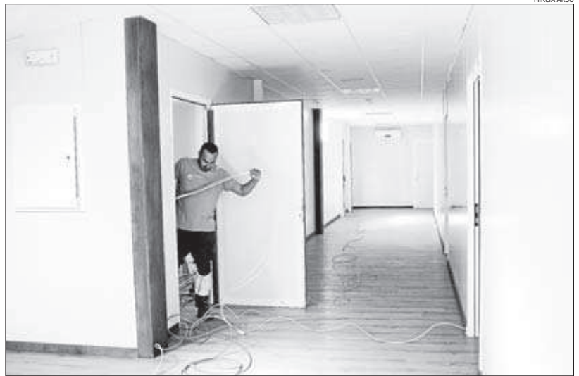
Un operari treballant a l'interior d'una de les noves cargoleres, que són de color blau. Ahir, a Comabella